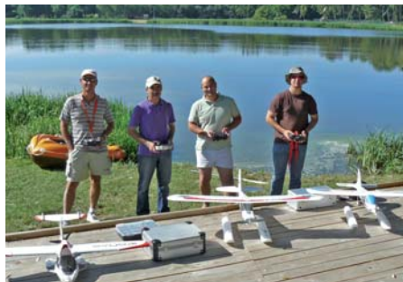
Le CACH37 a la chance de pouvoir accéder à plusieurs plans d'eau pour faire voler des hydravions électriques.