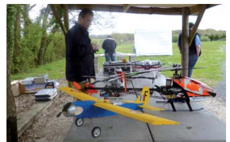
Le week-end sur le terrain, il y a du monde... et toutes sortes de modèles ! Avions, hélicos, planeurs et multi-rotors font bon ménage

En 2013, notre école est devenue Centre de formation agréé et en cette fin de saison 2014, nous venons d'enregistrer l'inscription de notre trente-septième élève. Bon nombre d'entre eux ont passé le brevet A et B puis une QPDD et parmi les premiers inscrits, deux sont devenus moniteurs.