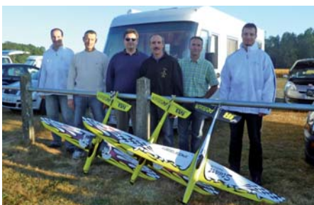
Les commissaires techniques du CACH37 lors d'une compétition F3D au MACCT de St Martin le Beau.

Paradoxalement, dans notre club, personne n'a mordu à la compétition. Pour faire découvrir cette facette de l'aéromodélisme à nos élèves, plusieurs moniteurs sont devenus Commissaires techniques. En offrant nos services aux clubs voisins, nous proposons à nos élèves de nous accompagner. C'est ainsi que depuis quelques années, sept commissaires sont chronomètres ou juges aux pylônes lors d'une compétition de racers F3D chez nos amis de Saint Martin le Beau. Ce n'est pas le championnat d'Europe, mais le niveau est très relevé. Cette année également, l'un d'entre nous faisait partie de l'équipe des chronomètres au championnat de France Electro 7 près de Chinon.