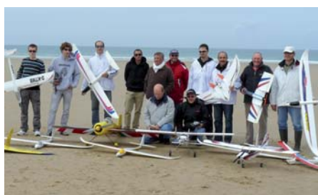
Le Cotentin, c'est aussi des vols sur d'immenses plages désertes. Que des modèles électriques bien sûr, mais sur une piste de 5 km de long et plusieurs centaines de mètres de large selon les marées !