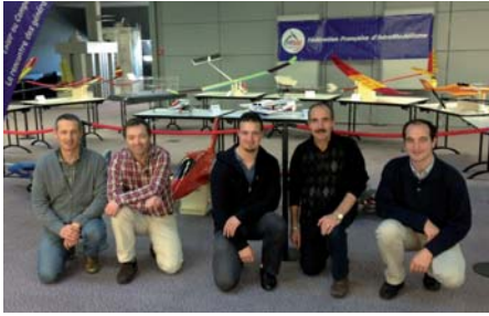
Le CACH37 lors de l'assemblée générale de la FFAM à Tours en mars 2014 avec quelques-uns de leurs modèles.