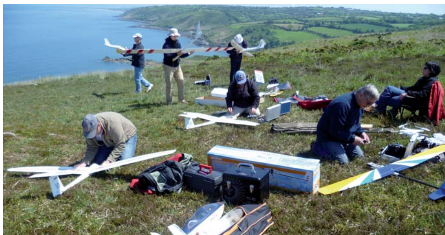
La sortie annuelle de vol de pente dans le Cotentin... Vols grand air et bonne humeur !