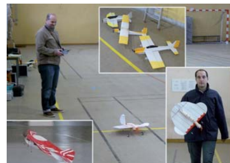
Une convention entre plusieurs clubs d'Indre et Loire permet au CACH37 de pratiquer l'Indoor dans un gymnase proche de Tours

On pourrait se croire tranquille et se sentir satisfait... mais c'est sans compter avec l'essor des nouvelles technologies... Comment accueillir les multicopters sur notre terrain ? Heureusement, nous avons des aéromodélistes curieux qui n'ont pas attendu que la question se pose pour s'intéresser à ce phénomène. Les premiers multi-rotors ont commencé leurs vols au CACH37 il y a presque 4