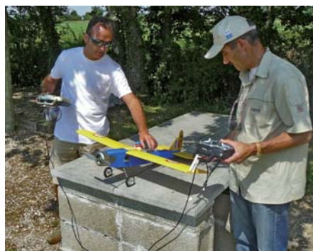
Le moniteur et l'élève en pleine PPV (préparation pour le vol) d'un des modèles de l'école.

Pour monter une école de toutes pièces, il faut d'abord des moniteurs. Nous sommes dix actuellement : sept pour les activités avion planeur, deux pour celles relatives à l'hélicoptère et un pour les multirotors. Arnaud, le responsable de l'école, établit annuellement un planning de rotation des moniteurs pour offrir aux élèves, entre fin avril et début octobre, un minimum de vingt cinq après-midi de formation au pilotage. Dès le début, avec l'aide du CDAM 37, nous avons pu nous équiper pour que les élèves soient formés sur du matériel club avant d'investir dans le leur. Les mois d'hiver sont consacrés à la formation technique avec des rendez-vous mensuels où après une présentation documentée, chacun peut échanger sur le plan pratique avec les modélistes plus aguerries.